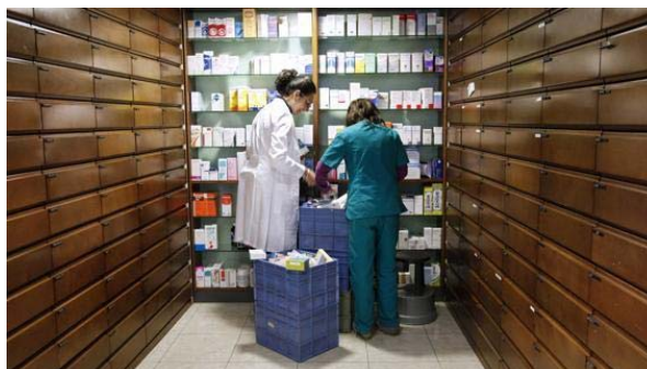
Il governo punta a riequilibrare la spesa farmaceutica

Per i ticket sanitari è arrivata l'ora di fare il tagliando. Troppo cari, soprattutto quelli su visite specialistiche e accertamenti diagnostici, ma la metà degli italiani - quelli che consumano più sanità - non li paga perché esenti o per reddito o per patologia. In quest'ultimo caso poi il diritto al tutto gratis scatta anche per i milionari. Un sistema pieno di controsensi che ora tutti dicono voler cambiare: Parlamento, Regioni e Governo.