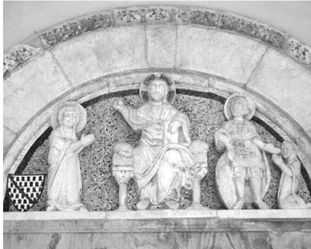
Benevento - Chiesa di Santa Sofia (sec. VII-VIII) con un bassorilievo del XIII sec. nella lunetta del portale romanico.